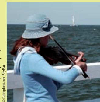
▶ Artyści umilają czas urlopowiczom