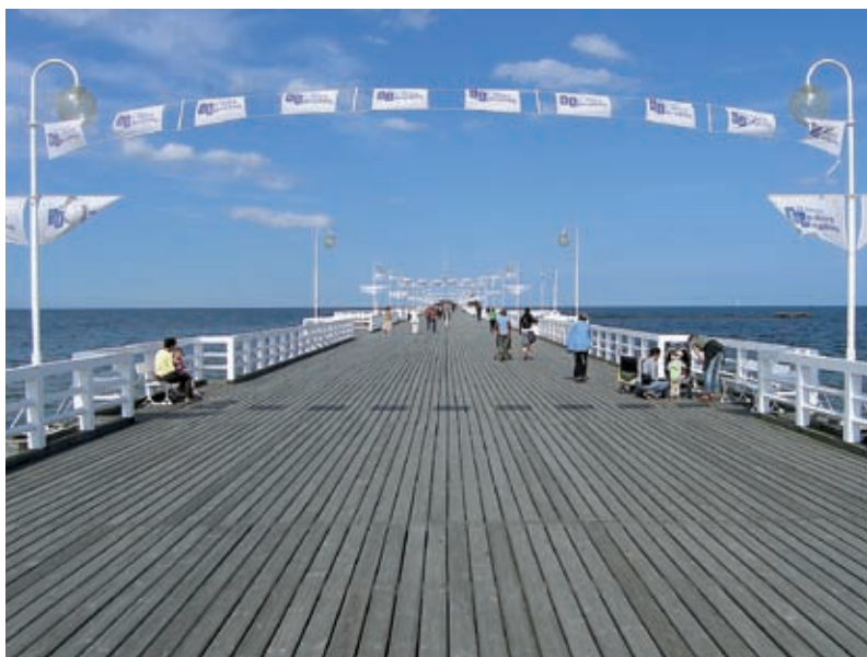
► Najśłynniejsze moło w Polsce

Równie znanym jak moło obiektem Sopotu jest OPERA LEŚNA , położona w północnej części miasta w zaciszu drzew, przy ul. Moniuszki 12. Ten zaduszony amfiteatr jest uważany za jedną z najpiękniej położonych scen na wolnym powietrzu w Europie. Wyróżnia go także doskonała akustyka. Początki obiektu sięgają 1909 r., gdy z inicjatywy kapelmistrza teatru miejskiego w Gdańsku, Paula Walther-Schäffera, wystawiono na zwykłej, trawiastej scenie operę Kreutzera. Do czasu II wojny światowej scena była kojarzona przede wszystkim z dziełami Wagnera. Od 1961 r. zaczęto tu organizować Międzynarodowy Festiwal Piosenki. Opera Leśna zajmuje teren o powierzchni 4 ha, na jej widowni zasiąść może 4400 widzów, a kanał dla orkiestry pomieści 110 muzyków.